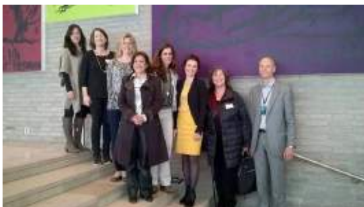
Imagem: almoço de trabalho na DnB, o maior grupo financeiro da Noruega, durante o qual se discutiu a participação equilibrada de mulheres e homens na gestão de topo.

Em maio, a equipa do projeto Igualdade de Género nas Empresas - Break Even (ISEG-ULisboa/ CESIS/ CIEG/ ISCSP-ULisboa) deslocou-se a Oslo no âmbito das relações bilaterais com parceiros do projeto.